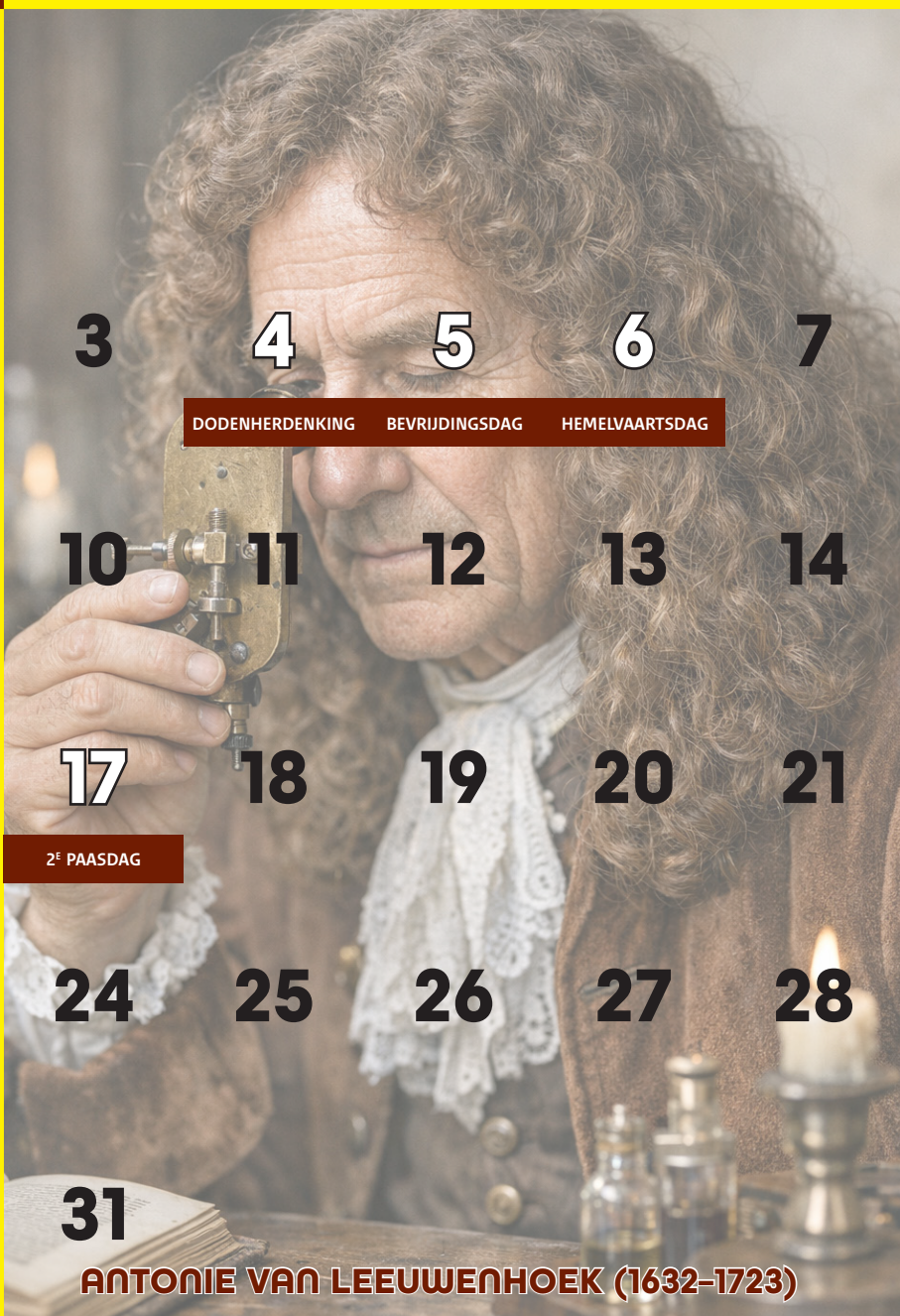
ANTONIE VAN LEEUWENHOEK (1632-1723)